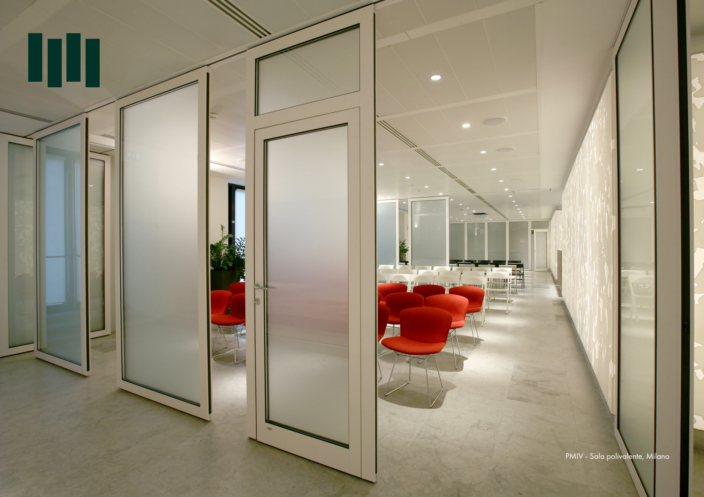
PMIV - Sala polivalente, Milano