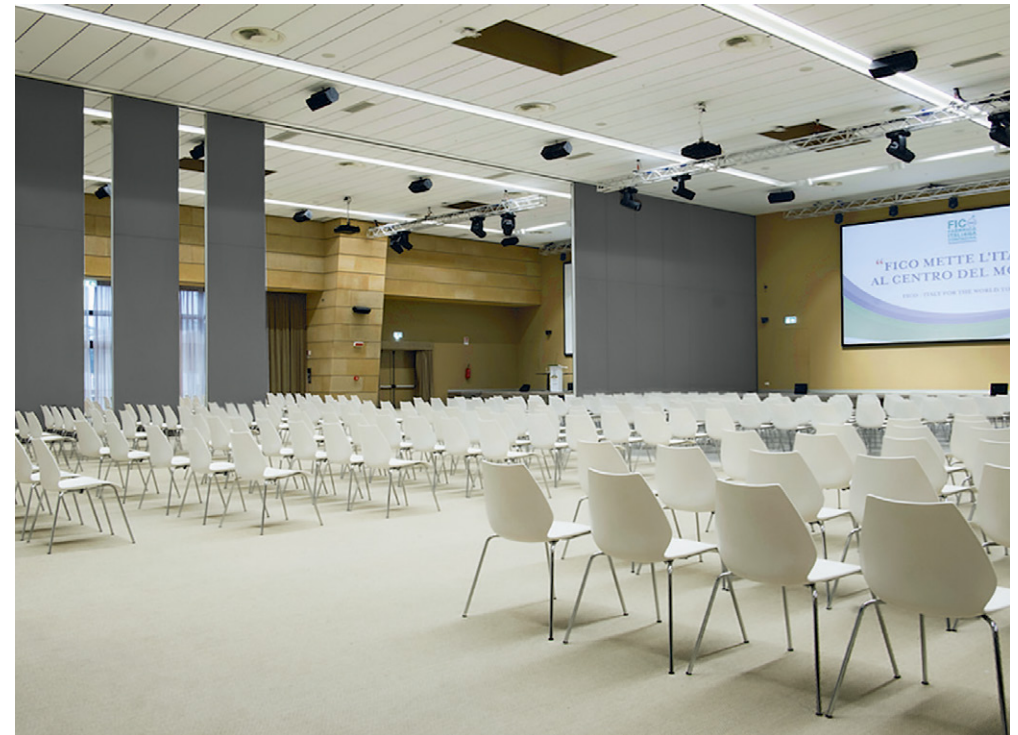
PMT - FICO Eataly, Bologna