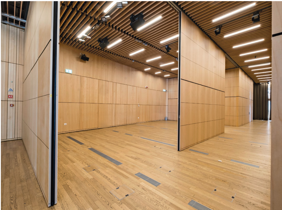
PMT - Unicredit Pavilion, Milano

The PMT (Taylor Movable Wall) product is manufactured after an accurate study by our R&D department. Anania turns the customer's special requirements into opportunities to design customized products, aimed to satisfy designers and customers.